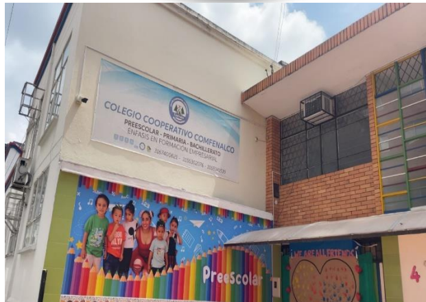
Figura 3. Entrada principal Preescolar