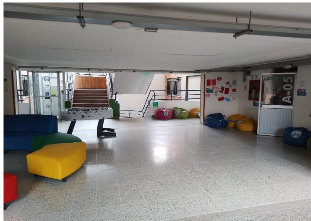
Figura 8. Pasillo de ingreso a los pisos do y tres y salones respectivos