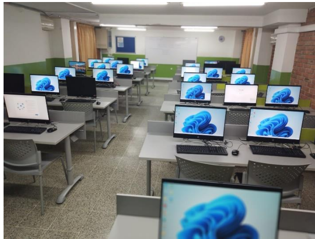
Figura 11. Sala de informática para 40 estudiantes