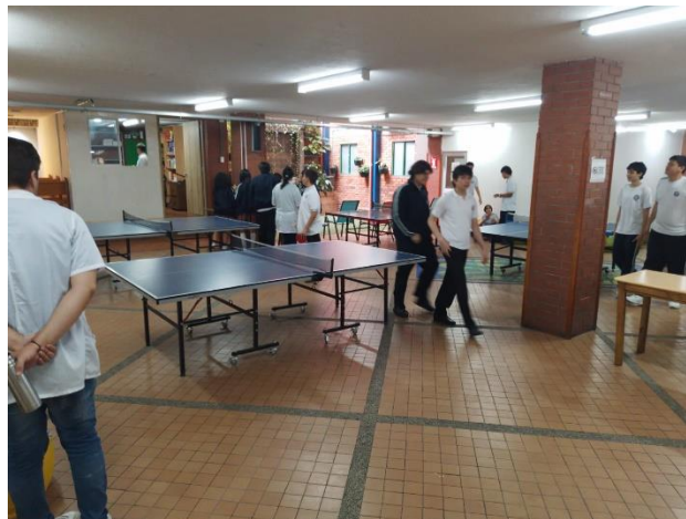
Figura 12. Sótano donde se cuenta con juegos, espacio para 500 personas, baños, enfermería, fotocopiadora.