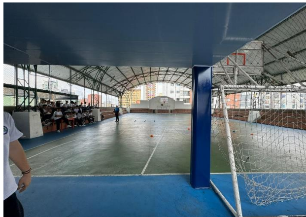
Figura 4. Coliseo en el cuarto piso del Colegio