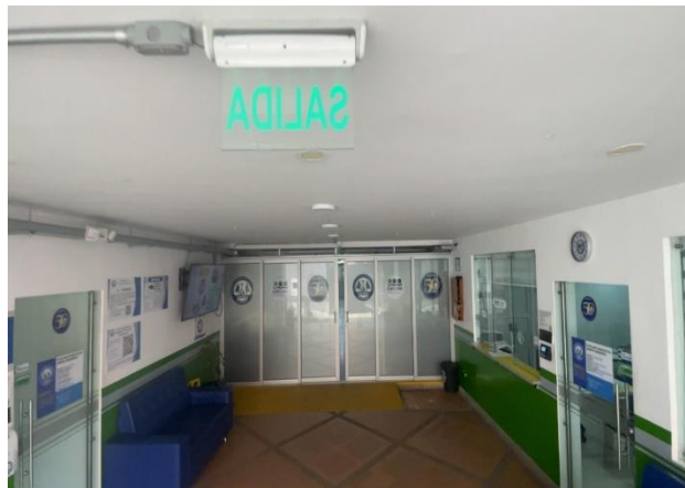
Figura 2. Entrada inicial a las oficinas administrativas