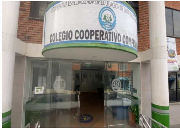
Figura 1. Entrada Principal del colegio Calle 21 con 37