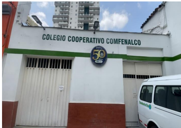
Figura 6. Entrada posterior por la carrea 22 con calle 37 y 38