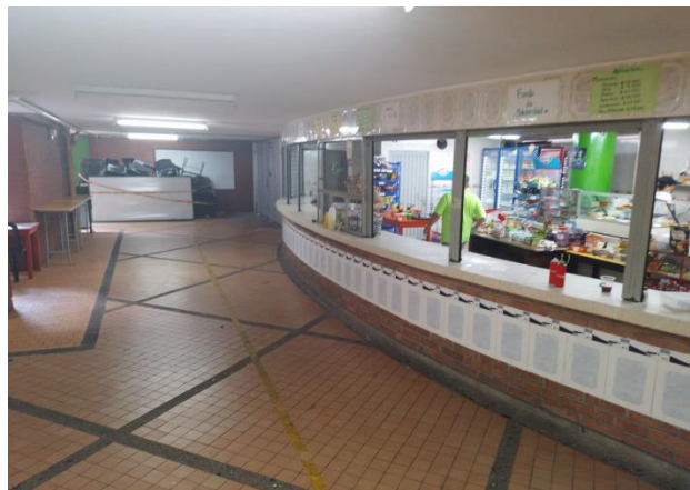
Figura 10. Cafetería en sótano del Colegio