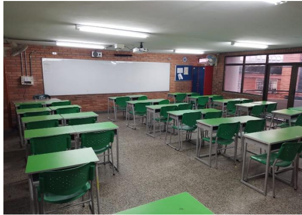
Figura 9. Modelo de salón (25 en total)