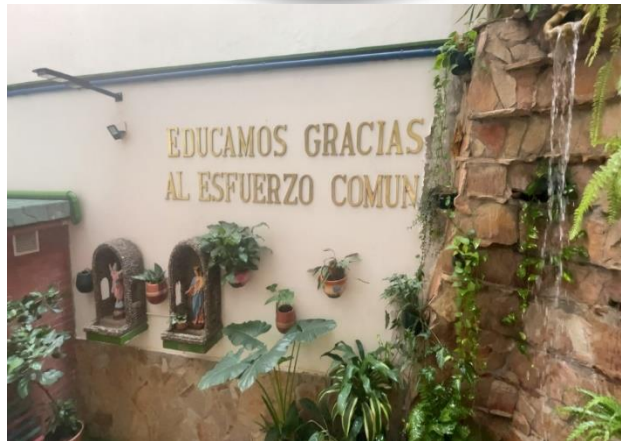
Figura 5. Entrada inicial escaleras a la cafetería